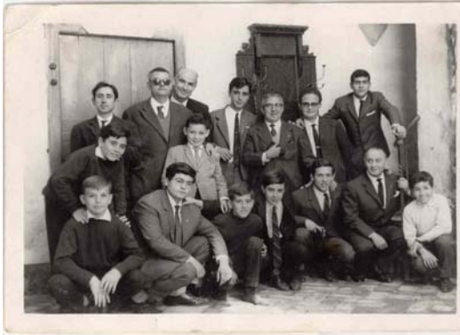
Grupo de hermanos año 1964