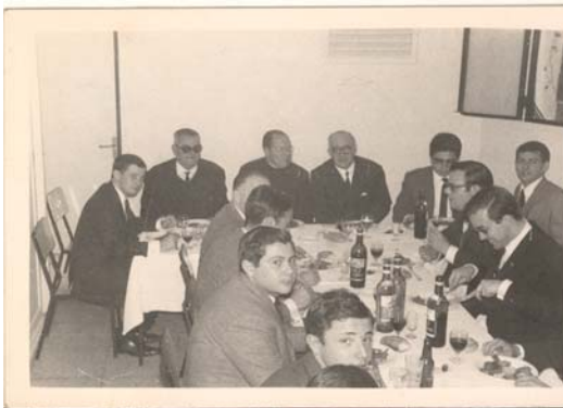
Primera comida de Hermandad año 1967