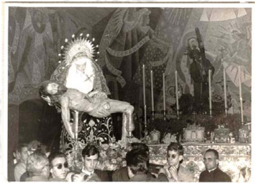
Misión de Sevilla 1965, nuestras imágenes junto al Gran Poder en la Parroquia de Santa Teresa.