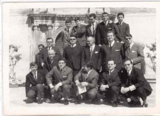
Grupo de hermanos año 1965