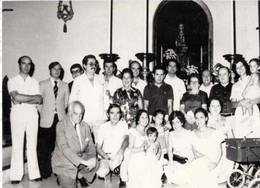
Grupo de Hermanos año 1978