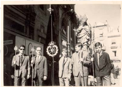
Representación de la Hermandad en la Procesión del Corpus en 1965